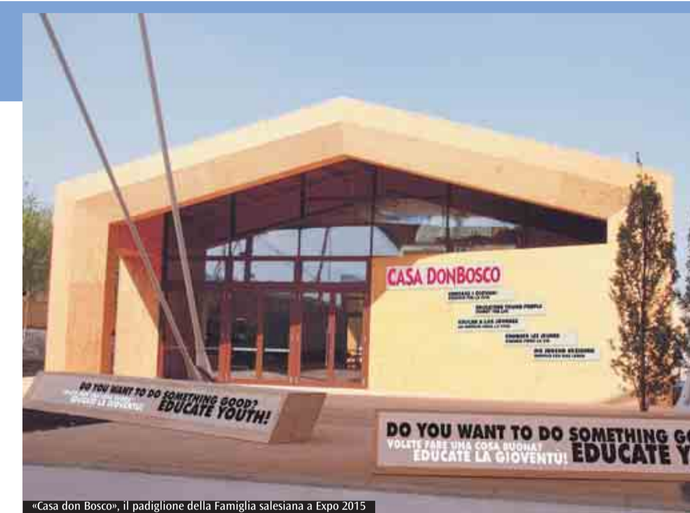
«Casa don Bosco», il padiglione della Famiglia salesiana a Expo 2015